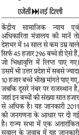
ये आंकड़े भारत के महारजिस्ट्रार की वेबसाइट की सूचना पर आधारित

एजेसी नई दिल्ली। केंद्रीय सामाजिक न्याय एवं अधिकारिता मंत्रालय की मानें तो देशभर में 14 साल से कम उम्र वाले सिर्फ 45 हजार 296 बच्चे ही ऐसे हैं, जो भिक्षावृत्ति में लिप्त पाए गए। उसमें भी उत्तर प्रदेश में सबसे ज्यादा 10 हजार बच्चे भीख मांगते पाए गए, जबकि दूसरे नंबर पर राजस्थान है, जहां इन बच्चों की संख्या सात हजार से अधिक है। यह जानकारी 2011 की जनगणना के आधार पर दी गई है। राज्य सभा में एक अंतरांकित सवाल के जवाब में यह जानकारी