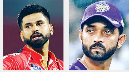
भुगतान पड़ रहा है। अय्यर ने 2025 में अपनी अगुआई में पंजाब किंग्स को फाइनल में पहुंचाकर खुद को साबित किया है और तीन अलग-अलग फ्रेंचाइजी-दिल्ली कैपिटल्स (2020), नाइट राइडर्स (चैंपियन 2024) और पंजाब किंग्स (2025) - को फाइनल तक पहुंचाने वाले पहले कप्तान बने।

मुश्किलों में घिरी कोलकाता नाइट राइडर्स की टीम सोमवार को फॉर्म में चल रहे पंजाब किंग्स के खिलाफ जब मैदान पर उतरेगी तो उसकी नजरों जीत के साथ मौजूदा इंडियन प्रीमियर लीग सत्र में अपने अंकों का खाता खोलने पर टिकी होगी। तीन बार की चैंपियन टीम अपने शुरुआती संघर्ष के लिए शीर्ष तेज गेंदबाजों पेसर मुस्ताफिजुर रहमान, हर्षित राणा, आकाश दीप और मथीशा पथिराना को गैरमौजूदगी को जिम्मेदार ठहरा सकती है लेकिन बड़ा मुद्दा टीम की गलत रणनीति है, जिसके कारण टीम ने अब तक अपने दोनो मैच गंवाए हैं। टीम को 2024 में उसे खिताब दिलाने वाले श्रेयस अय्यर को रिटेन (अपने साथ बरकरार रखना) नहीं करने का भी खामियाजा