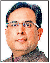
कार्यकर्ताओं से अपील की वे झंडा लगाने के साथ उसकी सेल्फी लें और उसे फेसबुक, इंस्टाग्राम व