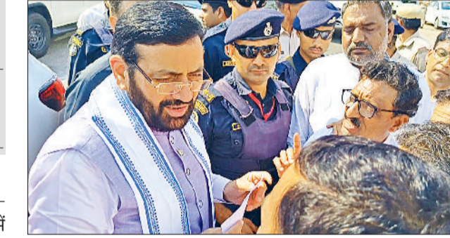
जुलाना। सीएम को मंडी संबंधी समस्याएं बताते आढ़ती व किसान।