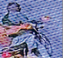
गुहला चौका। दुकान पर फायरिंग करते नकाबपोश।