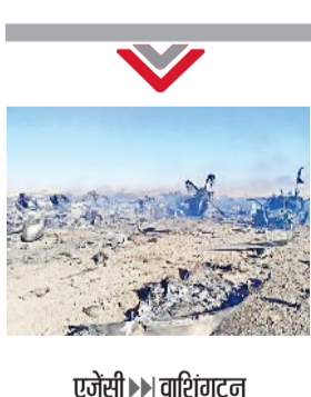
वाशिंगटन

नई दिल्ली। अरविंद केजरीवाल और अन्य आरोपियों ने दिल्ली हाई कोर्ट में जस्टिस स्वर्ण कांता शर्मा के सामने रिज्यूजल अर्जी दखिल की है। अरविंद केजरीवाल सोमवार को खुद कोर्ट में पेश होकर बहस करेंगे। इससे पहले सीबीआई-ईडी की विशेष अदालत ने सत्यों की कमी के आधार पर केजरीवाल, मनीष सिंसोदिया और अन्य आरोपियों को दिल्ली शराब नीति घोटाले में राहत दे दी थी, जिसे सीबीआई ने हाईकोर्ट में चुनौती दी है। एजेंसी